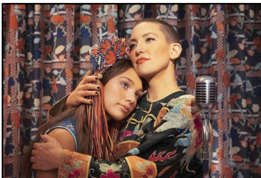
Maddie Ziegler jako Music, Kate Hudson as Zu

MUSIC łączy w sobie ciepłą opowieść o sile miłości z musicalowymi elementami, które napędzają i wzmacniają historię, przedstawiając widzom barwne życie postaci.