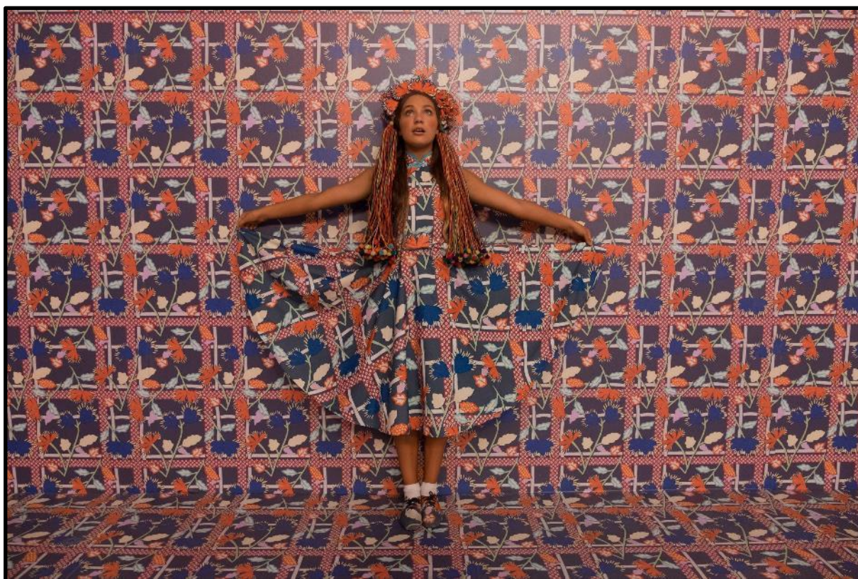
Maddie Ziegler jako Music