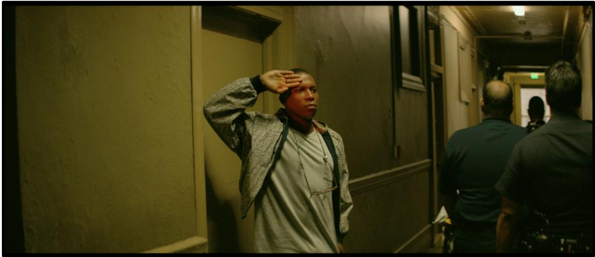
Leslie Odom Jr. jako Ebo

Kate: Uwielbiam cię, Sia, po prostu cię uwielbiam.